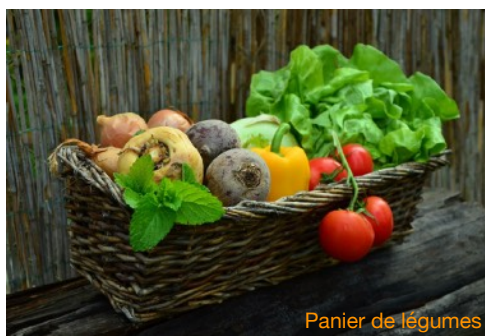
Panier de légumes

Confitures ou douceurs de fraises, de pêches roussannes, de raisins, de figues, de myrtilles; Sorbets aux fraises, framboises, cassis, groseilles; Coulis de myrtilles, de pêches roussannes